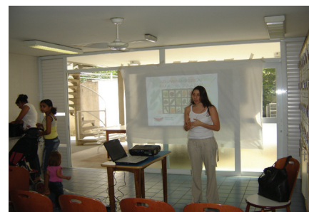
Evento realizado na ACTC utilizando os equipamentos de projeção.

O projetor e o notebook estão apoiando a realização de apresentações audiovisuais em palestras, festas e reuniões, tornando esses eventos mais produtivos e possibilitando a maior socialização das informações. Além disso, diminuíram os custos referentes ao aluguel desses equipamentos, solução adotada anteriormente à doação.