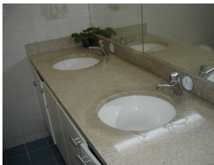
Torneiras doadas pela Central Geral do Dízimo e instaladas nos sanitários da ACTC.

As novas torneiras foram instaladas nos sanitários utilizados pelas mães/acompanhantes, crianças e adolescentes e já podemos sentir também o benefício indireto dessa doação, pois tivemos di-