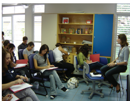
VI Programa de Voluntariado, realizado na sede da ACTC, no dia 21 de março de 2009.