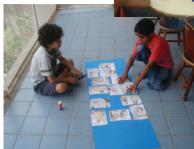
Rotina de atividades desenvolvidas para a produção de enfeites da Festa de Carnaval.