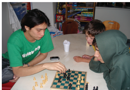
Atividade Adolescente Cultural realizada na dependências da ACTC.