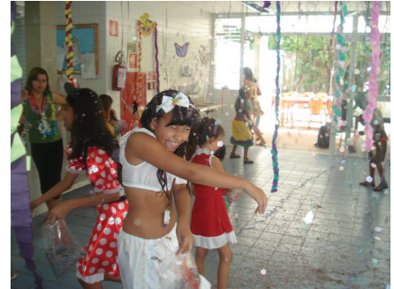
Crianças e mães brincam com confetes e serpentina.

ficar de fora: também caíram na dança contagiados pela alegria das crianças, adolescentes e mães.