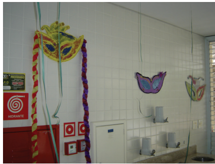
Máscaras e enfeites colocados no refeitório.

Ao colocarmos a música, as crianças começaram a dançar e a jogar confetes