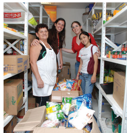
Equipe da FIAP entrega alimentos e itens de higiene arrecadados no Trote Solidário.

Cumprimentamos todos os funcionários e alunos da FIAP pela iniciativa e agradecemos de coração pela doação!