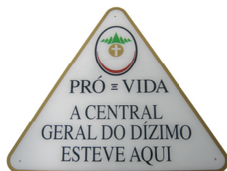
Placa comemorativa recebida pela ACTC da Central Geral do Dízimo.

Renovamos nossos agradecimentos à Central Geral do Dízimo - Pró-Vida, instituição Amiga de Coração da ACTC que, ao longo de 2008, doou equipamentos para a área de informática, torneiras para os sanitários da sede da ACTC e equipamentos eletro-eletrônicos para a nova unidade que atenderá os adolescentes.