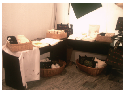
Material do Artesanato Maria Maria exposto na Mostra/Acessórios Inverno 2009.

Evento divulga o Artesanato Maria Maria produzido pelas mães/acompanhantes da ACTC